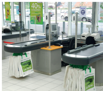
De Welser-profielen voor de winkelrichting zijn functioneel en esthetisch geavanceerd.