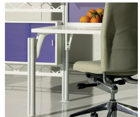
De scheidingswandenstaanders van Welser garanderen exacte maatvoering en modulariteit.