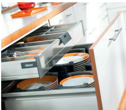
Ons hang- en sluitwerk heeft een onberispelijke optiek.