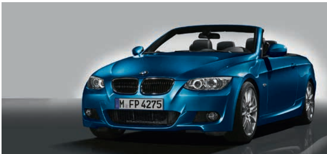
Профили в автомобиле в качестве направляющих для сидений, усилений, тяг, направляющих, держателей модулей и т.д.

Использование высоко-, особовысокопрочных и ультрапрочных сталей.