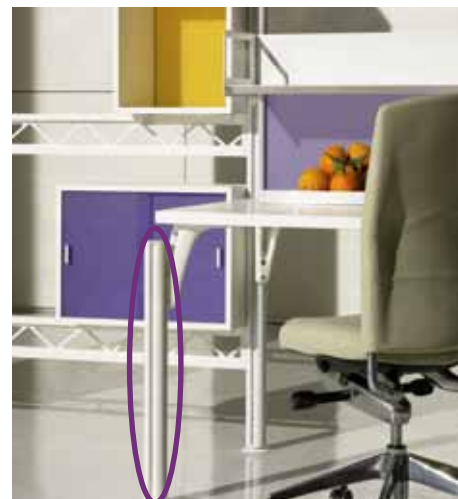
Welser Profile gagne des points dans la fabrication de meubles avec des variantes d'état de surface diverses.