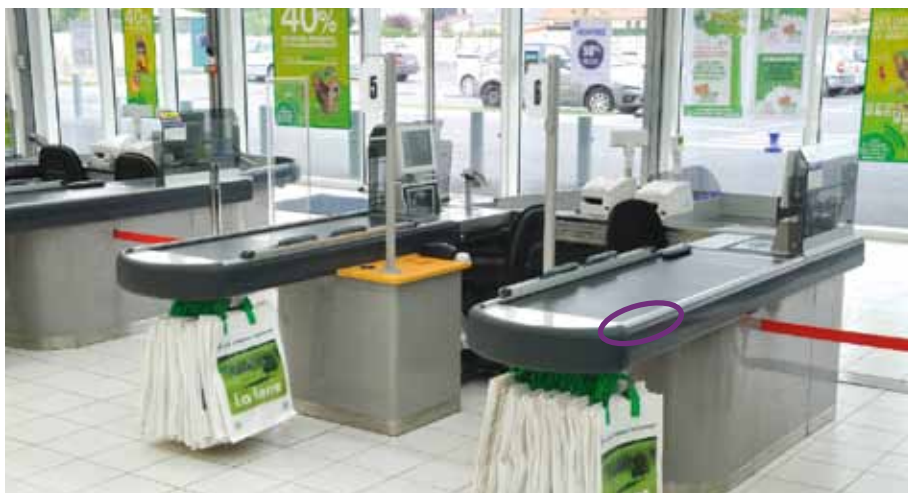
Les profils Welser pour l'aménagement de magasins sont fonctionnels et esthétiques.