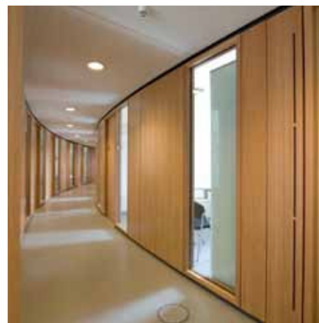
Les poteaux de cloisons de Welser garantissent la tenue des cotes et la modularité.