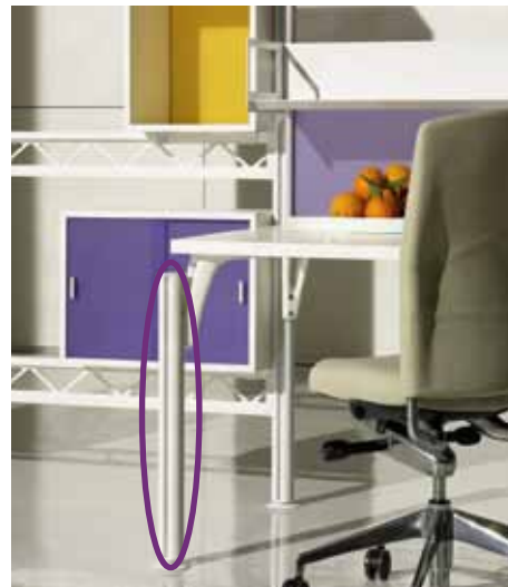
Welser destaca con las más variadas superficies en el sector de los muebles.