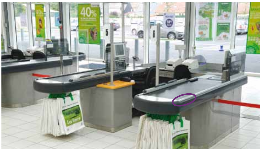
Funcionalidad y estética – los perfiles Welser para equipamiento de tiendas.