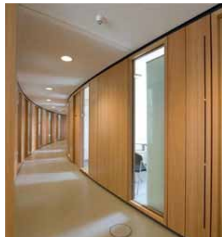
Mellanväggsstolpar från Welser garanterar måttexakthet och modularitet.