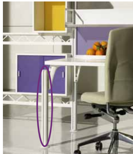
Welser Profile arbetar med de mest olika ytutförandena inom möbelkonstruktion.