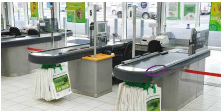
Функциональные и эстетически взыскательные профили Welser для торгового оборудования.