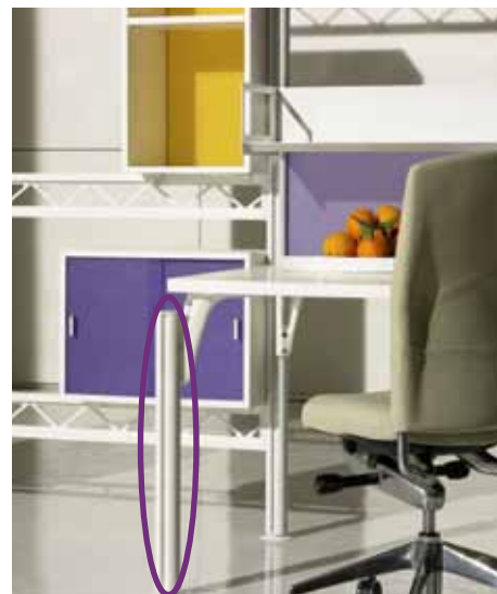
Welser Profile выделяется самыми разнообразными свойствами поверхностей в мебельных конструкциях.