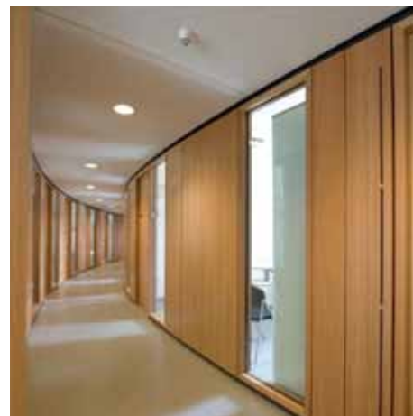
Słupki ścianek działowych sprawdzają się w rozwiązaniach modułowych i są dokładnie wykonane.