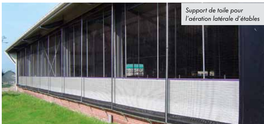
Support de toile pour l'aération latérale d'étables