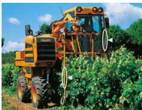
Profil de cabine ainsi que arbre pour les trains de roulement de machines à vendanger