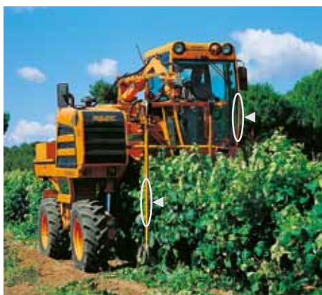
Perfil para cabinas de vendimiadoras