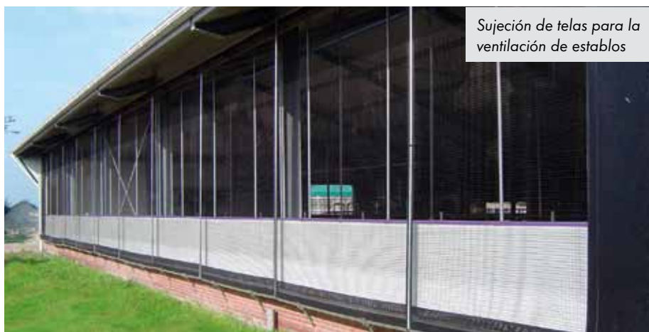
Sujeción de telas para la ventilación de establos