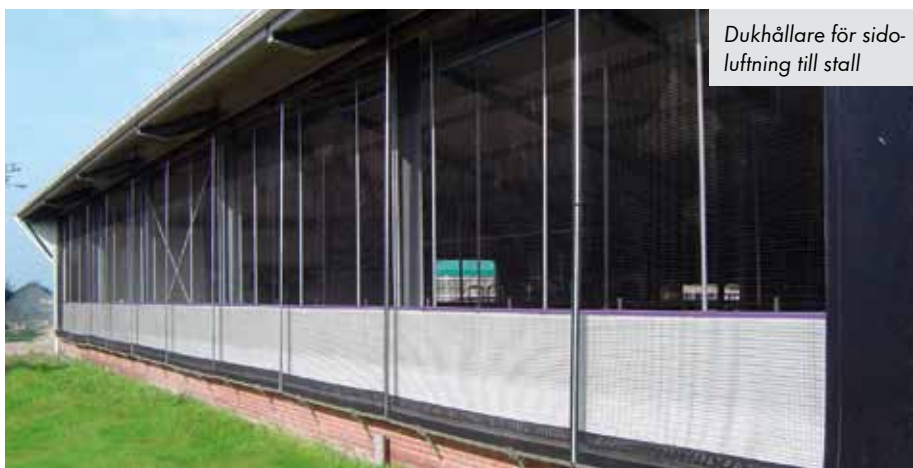
Dukhållare för sidoluftning till stall