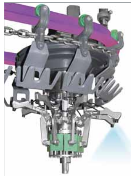
Löpskena (lila) till transportsystem i slakthus