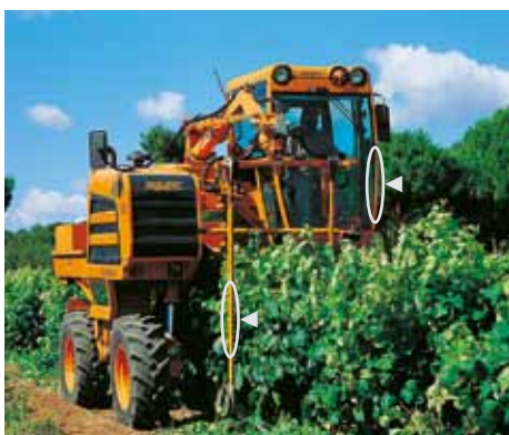
Hyttprofil samt våg för rullbanor för vinskörmaskiner