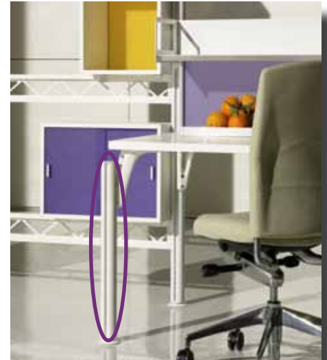
Welser Profile punktet mit verschiedensten Oberflächenausführungen in der Möbelkonstruktion.