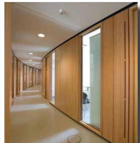
Trennwandsteher von Welser garantieren Maßhaltigkeit und Modularität.