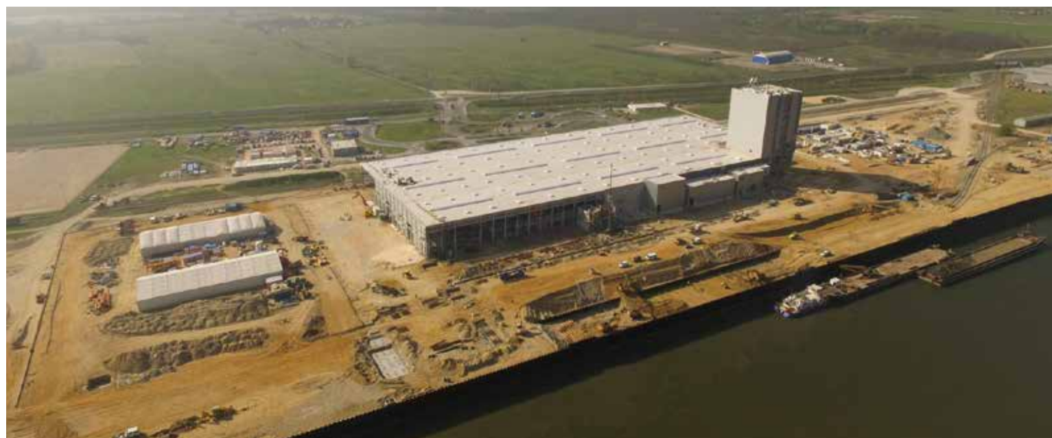
Die Wuppermann-Gruppe baut auf dem 80.000 m 2 großen Grundstück vier Produktions- und Logistikhallen mit einer Gesamtfläche von etwa 32.000 m 2 .

Die Warmbandbeiz-/feuerverzinkungsanlage wird aus heutiger Sicht planmäßig im vierten Quartal 2016 ihre Produktion aufnehmen. Welser beabsichtigt, ab 2017 gebeiztes bzw. feuerverzinktes Spaltband von WH zu beziehen.