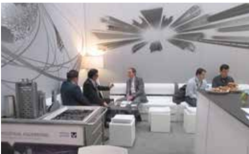
Der große Loungebereich bot die Möglichkeit für ausführliche Gespräche mit den Kunden und Interessenten.

Von 11. bis 17. April 2016 präsentierten wir uns nach längerer Pause erstmals wieder auf der Bauma, der Weltleitmesse für Baumaschinen, Baustoffmaschinen, Bergbaumaschinen, Baufahrzeuge und Baugeräte. Unser Messestand war diesmal in erster Linie auf Bestandskunden ausgerichtet, machte aber durch seine Bauweise - er war an vier Seiten geschlossen - auch Neukunden neugierig.