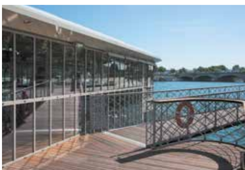
Außenaufnahme der „Rosa Bonheur“.

Der ehemalige Frachtkahn wurde aufwändig renoviert – fast ausschließlich aus Stahl und Glas zeigt sich die „Rosa Bonheur“ heute. Der Innenraum wurde umschlossen von einer Glasfassade mit sehr schlanken Stahlprofilen realisiert. Das RP-hermetic FINELINE Profil mit nur 36 mm Ansichtsbreite zeigt sich prädestiniert für diesen Einsatz, wird das System doch überwiegend bei der Sanierung von historischen Gebäuden verwendet. Zudem kamen noch sechs Türen der Serie RP-hermetic 55N zum Einsatz. Das verarbeitungsfreundliche und gleichzeitig funktionale, nicht wärmedämmte Türsystem fügt sich harmonisch in das Gesamtkonzept ein.