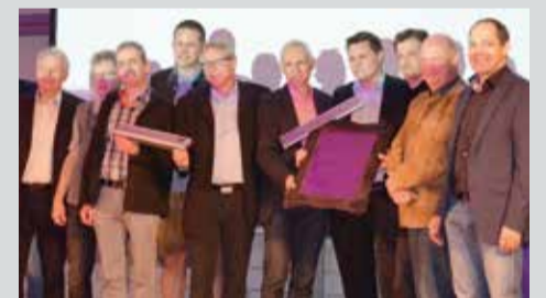
Feierliche Übergabe der Jubiläumszarge.

Die Hauptattraktion des Abends war aber ein besonderer „Ehrgast“. Gemeinsam mit einem gelaserten Edelstahl-Lieferschein – gerahmt in einem