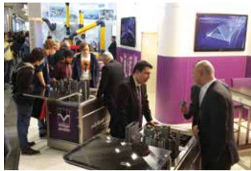
Die diesjährige Swissbau lockte junges, interessiertes Publikum auf unseren Messestand.

Obwohl sich die Schweizer Baukonjunktur seit dem Rekordjahr 2014 etwas abgekühlt hat, vermag das Thema weiterhin zu begeistern. An fünf Tagen war Basel erneut Branchentreffpunkt und Innovationsplattform der Bauwirtschaft.