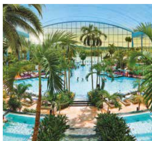
Die Thermen- und Badewelt Euskirchen (Deutschland).

Ein architektonisches Highlight der Anlage ist das gigantische Glasdach mit einer 200 Tonnen schweren Glaskuppel, das sich an warmen Tagen auf Knopfdruck öffnen lässt, sodass die Besucher die schönen Sommertage unter freier Luft genießen können.